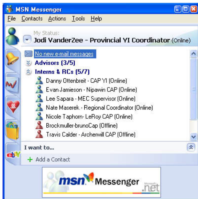
Figuur 1: Het is mogelijk om te zien wie er 'actief' is (wat verder reikt dan zien wie er 'online' is).